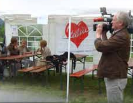
Rallye vum 1. Juli 2007