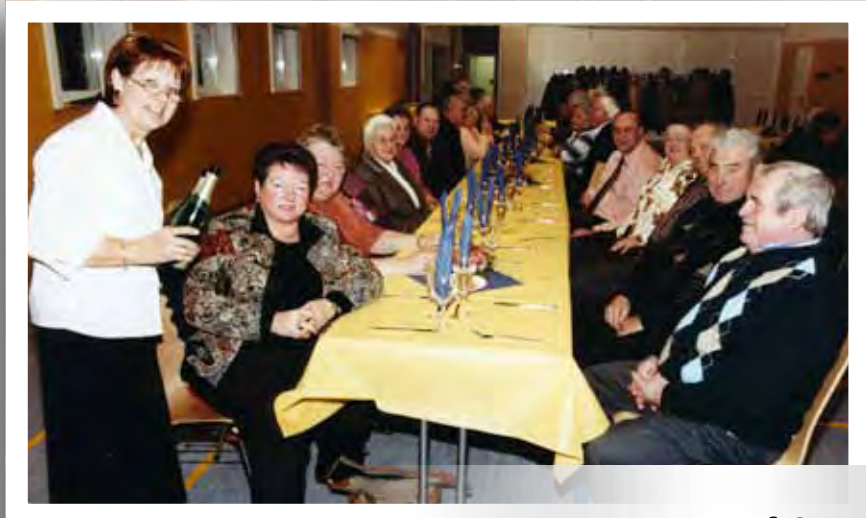
Rentnerfeier 29. November 2007