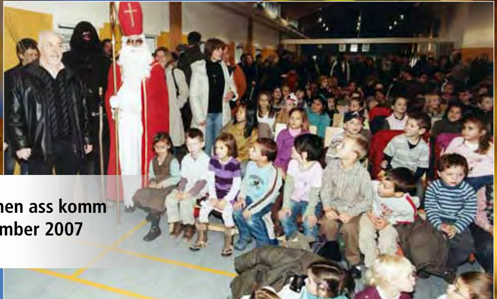
De Kleeschen ass komm 1. Dezember 2007