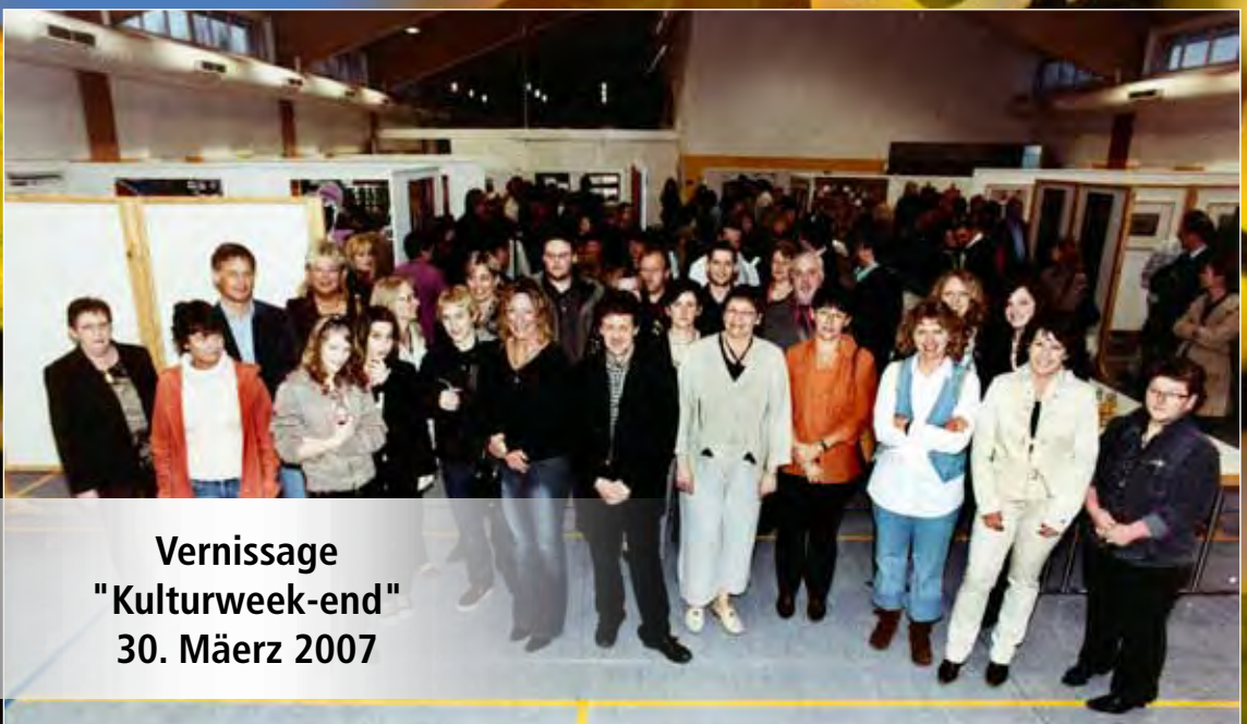
Vernissage "Kulturweek-end" 30. Mäerz 2007