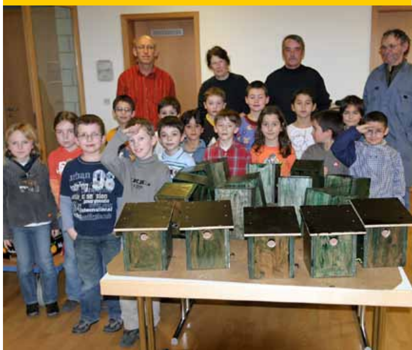
d'Kanner aus dem 2. Schouljoër hunn an Zesummenaarbecht mat der Lëtzebuerger Natur- a Vulleschutzliga, Sektioon Réimech, Vullenhaisercher gebaut