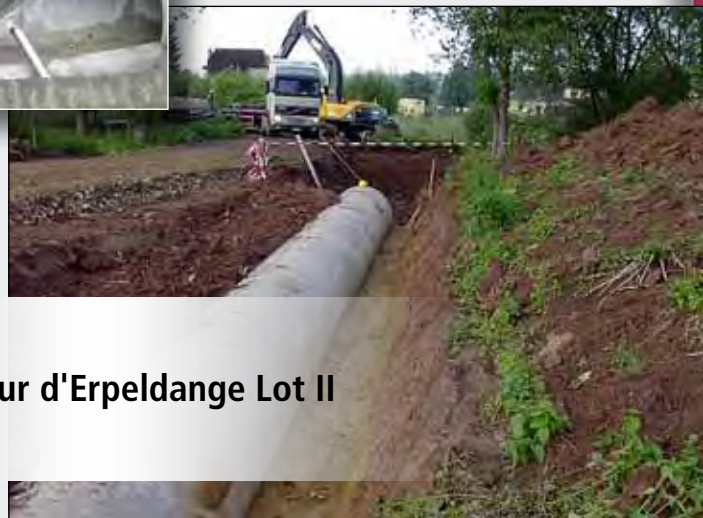
Collecteur d'Erpeldange Lot II