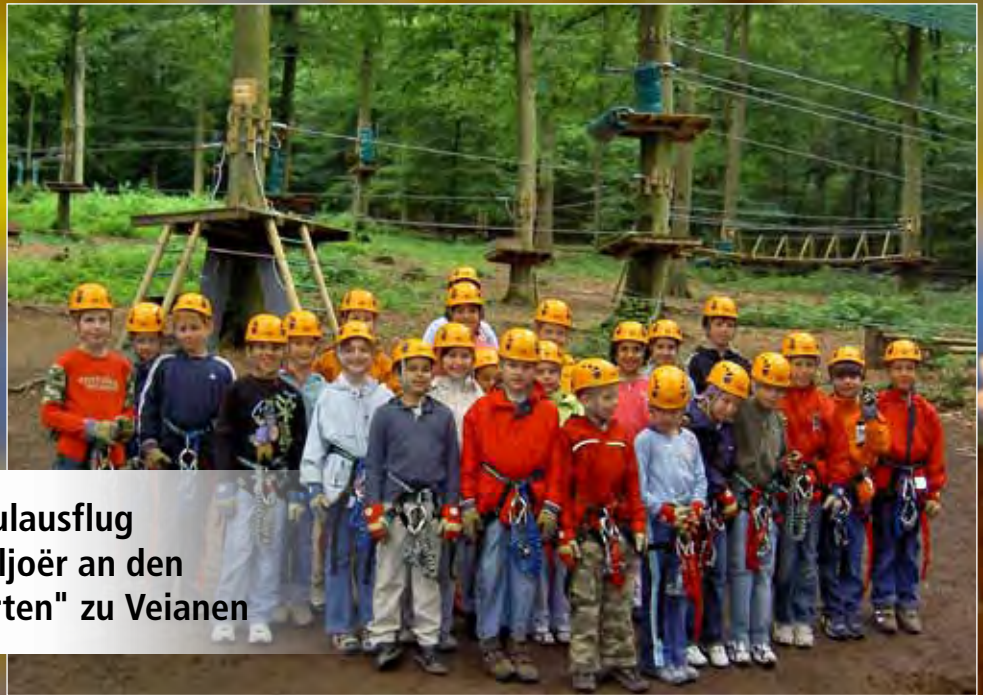
Schoulausflug 3. Schouljoër an den "Hochseilgarten" zu Veianen