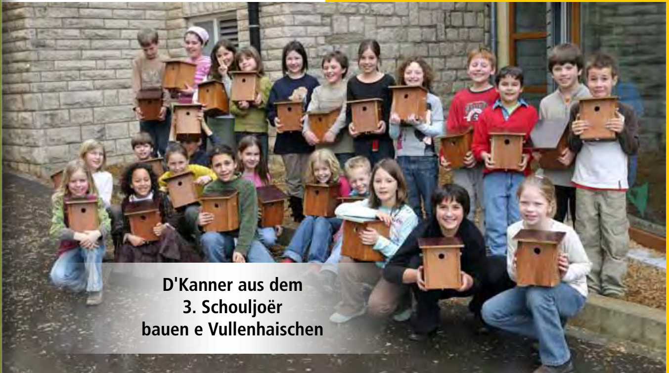
D'Kanner aus dem 3. Schouljoër bauen e Vullenhaischen