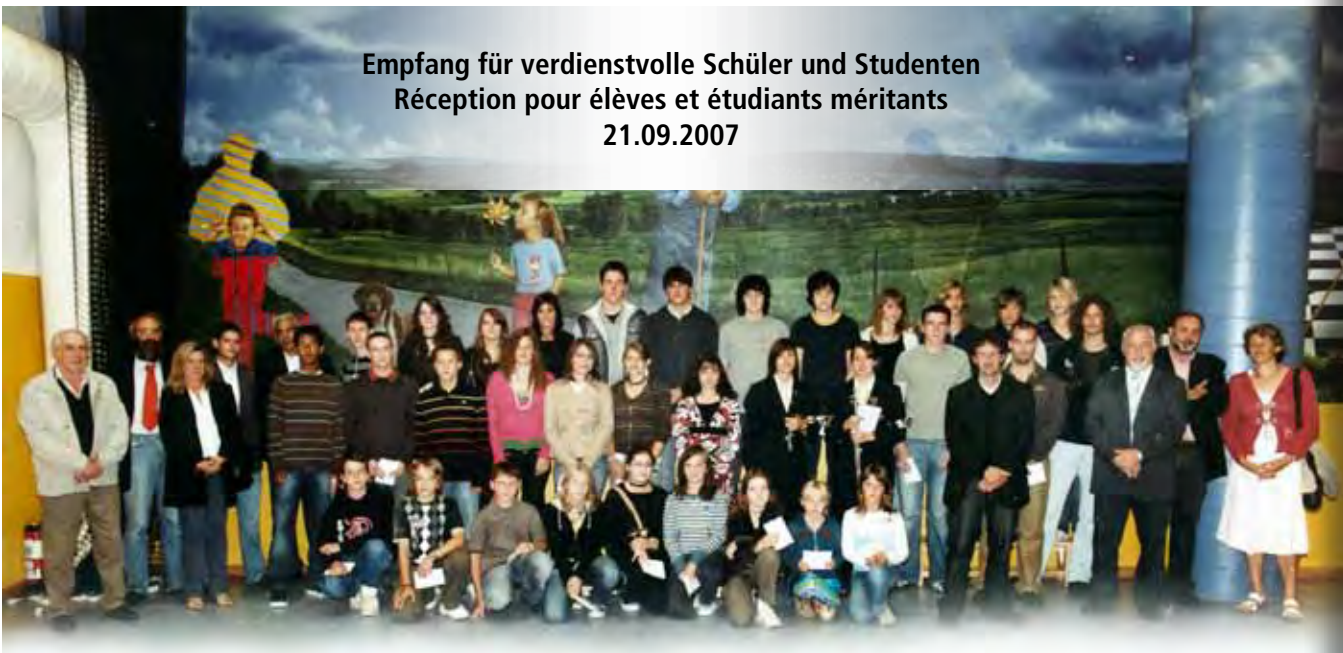
5.400 € wurden an 38 Schüler und Studenten verteilt 5.400 € ont été distribués à 38 élèves et étudiants