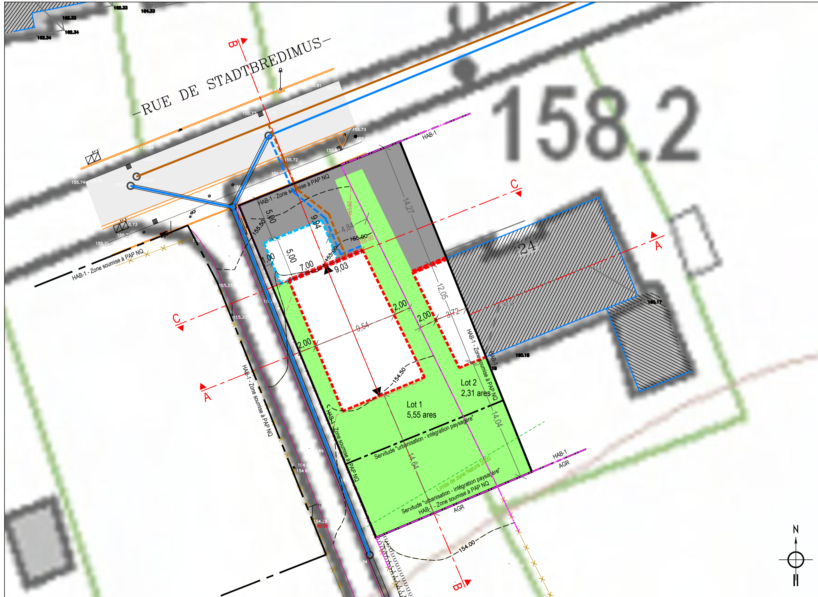
Projet d'Aménagement Particulier 1/250